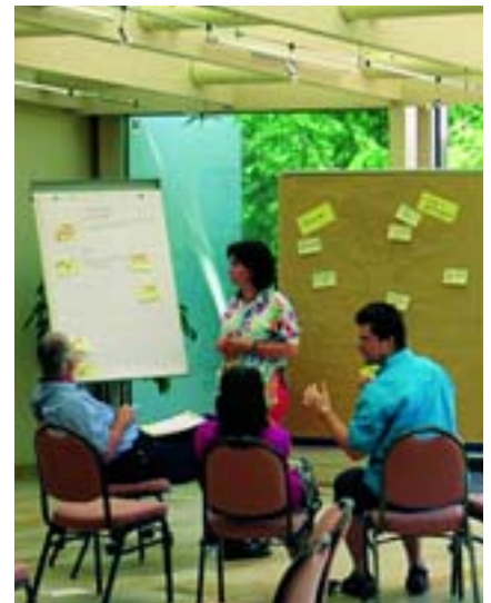
... und eine vertiefte Auswertung.