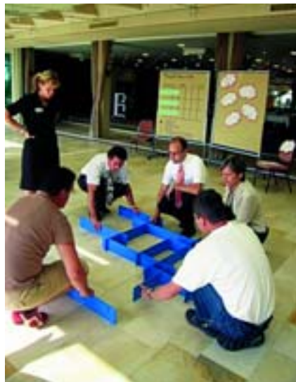
... viel eigenes Erleben im Team ...