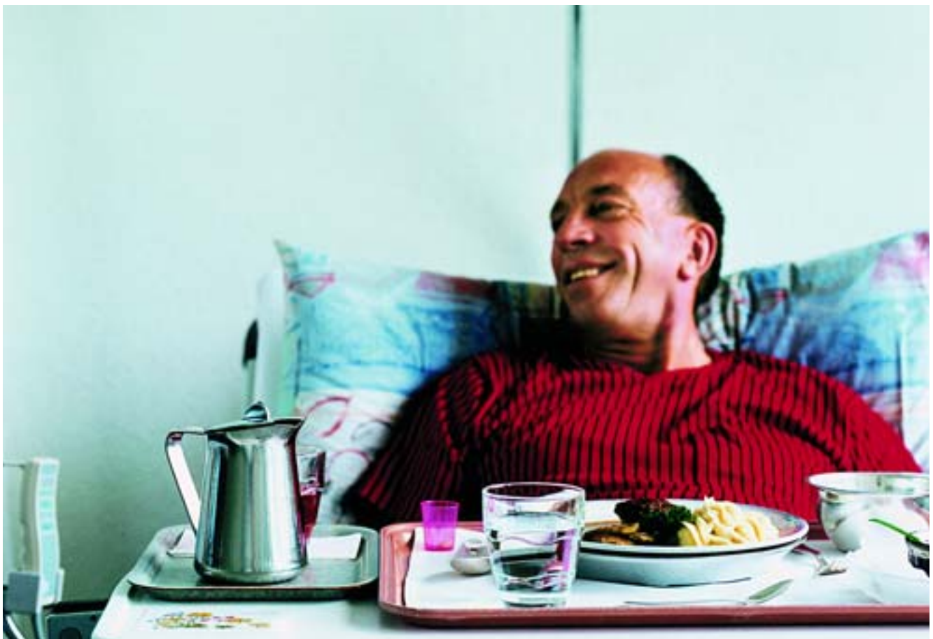
Im Bereich Krankentaggeld ist der Carnavi Holding AG die Nähe zu den Mitarbeitenden wichtig.

auszuwerten. Wir nutzen diese Option. Ich bin beispielsweise in der Lage, die einzelnen Betriebe in Bezug auf verschiedene Kriterien miteinander zu vergleichen und Führungsgrundlagen für das Absenzenmanagement zur Verfügung zu stellen.