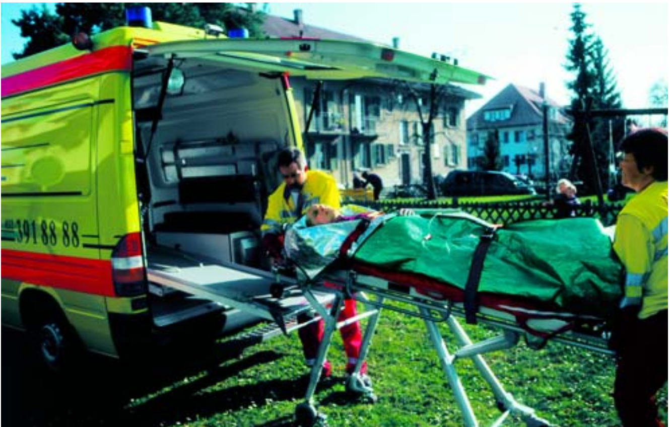
Viele Unfälle passieren in der Freizeit.

Per 1. Januar 2007 muss erstmals ein Umlagebeitrag von 3% auf der Nettoprämie der Berufs- und Nichtberufsunfallversicherung erhoben werden, um die Finanzierung der Teuerungszulagen auf Invaliden-, Witwen- und Waisenrenten sicherzustellen (siehe Kasten).