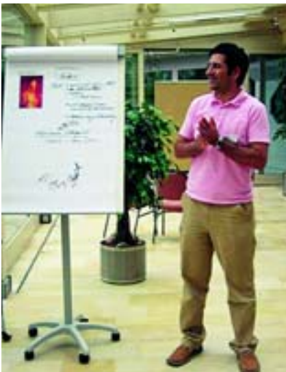
Die Schulungen beinhalten Theorie ...

In den Schulungen steht das gemeinsame Erarbeiten von Lösungen im Vordergrund. Beispiele aus dem Führungsalltag werden